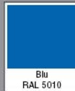
Blu RAL 5010