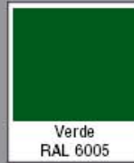
Verde RAL 6005