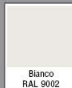
Bianco RAL 9002