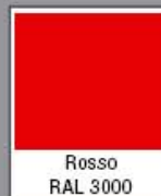
Rosso RAL 3000