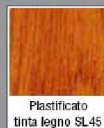
Platicato tinta legno SL45