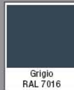
Grigio RAL 7016