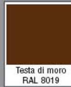
Testa di moro RAL 8019