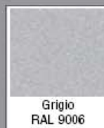
Grigio RAL 9006