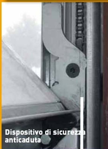
Dispositivo di sicurezza anticaduta