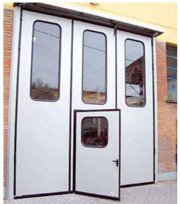
Versione del portone installato all'esterno