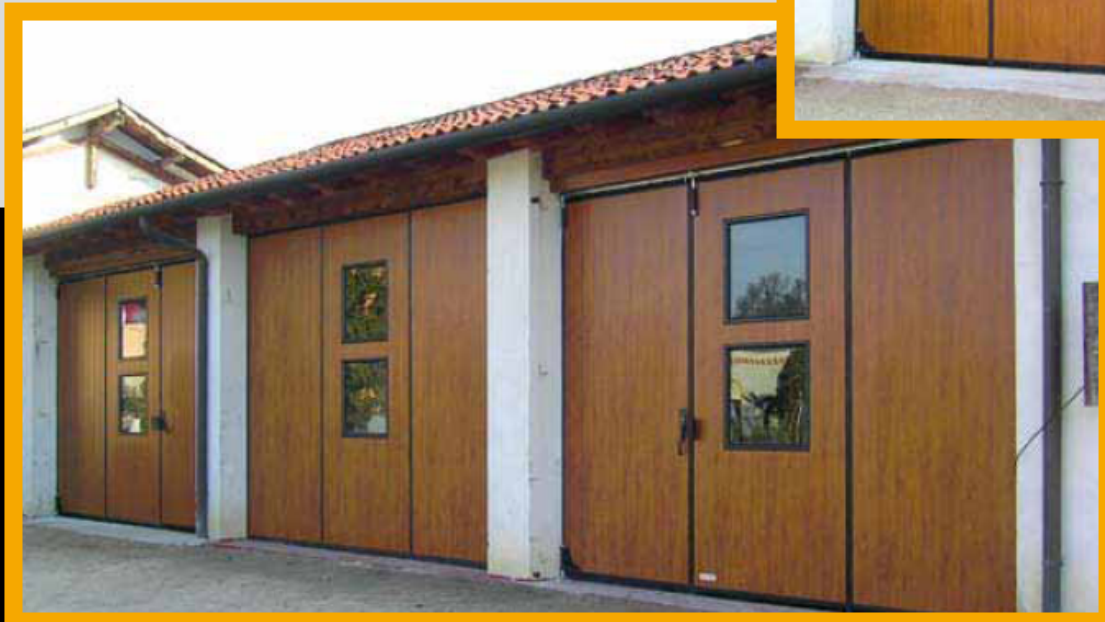
Manto simil legno